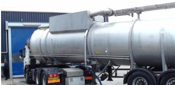
Fotografia: Specjalnie zaprojektowana cysterna przygotowuje się do wjazdu do hali przyjęć odpadów w duńskiej biogazowni CAD. Przetładunek odbywa się w całości wewnątrz zamkniętego budynku, z którego powietrze jest odsysane do filtrów odorów. Ponadto każda cysterna jest myta przed opuszczeniem budynku.

Oprócz tego biogazownia CAD znacząco zmniejsza emisję gazów cieplarnianych dzięki wyeliminowaniu odpadów składowanych na wysypiskach, rozrzucania bezpośrednio na pole oraz innych dróg emisji. Biogazownia CAD o mocy 1 MW eliminuje emisję równoważną 116 tys. ton CO 2 rocznie dzięki wykorzystaniu metanu jako paliwa. Jest to jedna z najbardziej ekonomicznych metod zmniejszenia emisji gazów cieplarnianych. Biogazownie rolnicze wykorzystują w bardzo niewielkim stopniu surowce (obornik i rośliny uprawne), a więc w niewielkim zakresie przyczyniają się do zmniejszenia emisji gazów cieplarnianych.