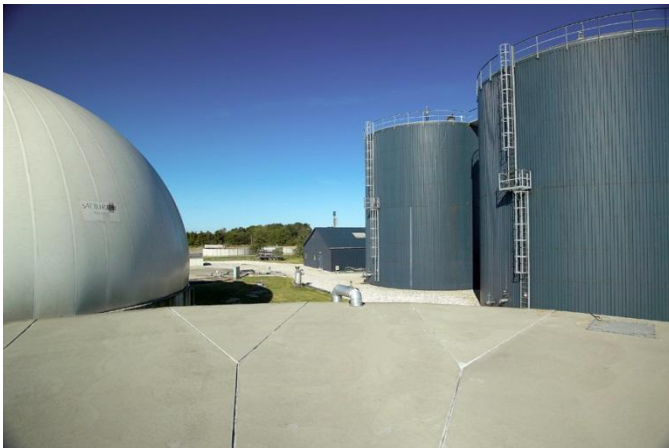
Fotografia: Biogazownia w Thorso (Dania), 2011 r.

Mamy w Polsce do czynienia z fundamentalnym niezrozumieniem problematyki biogazu i to nie tylko wśród opinii publicznej lecz także w sferach rządowych. Przedstawiciele władz często mówią o „biogazie rolniczym” i wskazują na dużą liczbę zakładów w Niemczech, które miałyby posłużyć jako wzór do naśladowania w Polsce. Jednakże z wielu powodów model ten nie zadziałał w Polsce. Wraz ze zmianami w prawie taka sytuacja może ulec korzystnym zmianom. W dyskusjach często pomija się rolę jaką w sektorze gospodarki biogazem i odpadami odgrywa fermentacja odpadów. Scentralizowane zakłady fermentacji beztlenowej (zwane biogazowniami CAD — central anaerobic digestion ), wprowadzone po raz pierwszy w Danii, okazały się najbardziej udanym podejściem w sektorze biogazu. Profesor Jerzy Buzek, były polski premier, były przewodniczący Parlamentu Europejskiego i jego były sprawozdawca w zakresie rozwoju technologii energetycznych w Unii Europejskiej, określił duńskie podejście i technologię jako model dla rozwoju tej dziedziny w Polsce. Nasza firma planuje zbudować w Polsce ponad dwadzieścia takich zakładów. Scentralizowane biogazownie korzystają z odpadów pochodzących z terenów sąsiadujących, uwzględniając nie tylko obornik, ale także odpady z ubojni, osad ściekowy, odpady żywności z gospodarstw domowych i różnego rodzaju odpady z